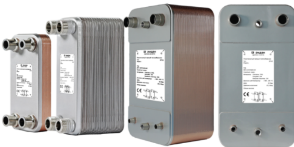
Рис.1 - Внешний вид теплообменников пластинчатых типа ВРНЕ

Теплообменники пластинчатые типа ВРНЕ предназначены для передачи тепловой энергии от одного теплоносителя к другому. Теплообменники пластинчатые типа ВРНЕ могут применяться в холодильных установках (компрессорных, абсорбционных), а также в тепловых насосах. В качестве рабочих сред могут использоваться негорючие хладагенты (фторуглероды, хлорфторуглероды, аммиак, CO 2 ), технические и холодильные масла, вода для технических нужд и систем ГВС, спиртосодержащие растворы.