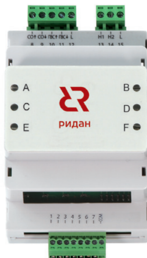
Рис. 1 Внешний вид модуля Р-РМ

Представляет собой печатную плату с расположенным на ней твердотельными реле с выходами на винтовые разъемы в корпусе для монтажа на din-рейку.